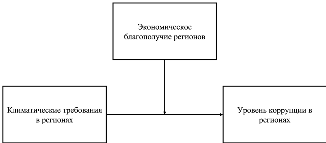
Рисунок 1 – Базовая концептуальная схема исследования взаимосвязи климатических требований регионов и их экономического благополучия с коррупцией на региональном уровне

Второе эмпирическое исследование посвящено изучению взаимного детерминирования коррупции на индивидуальном уровне, или приемлемости коррупции, факторами регионального уровня (климато-экономических характеристик регионов) и факторами индивидуального уровня (ценностными ориентациями населения регионов). Базовая концептуальная модель второго эмпирического исследования представлена на рисунке 2.